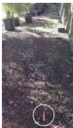
à l'ombre de la maison

3. Au bout d'une heure, ramassez la spatule avec précaution afin que les fourmis restent sur le bâton, examinez attentivement ces fourmis, et voyez si: • Elles sont oranges ou rouges. • Elles font moins de 2 mm de long. Si ces deux éléments correspondent, il est fort probable que vous ayez des Petites Fourmis de Feu dans votre propriété.